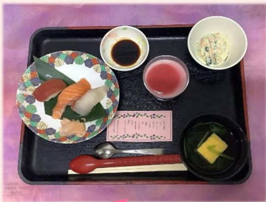
常食（普通食） 一口大はカットします

実際に入居者様にご提供しているお食事です。本人様の嗜好や状態に合わせた食事形態にしており、皆様に安全においしく召し上がっていただけるようにしています。