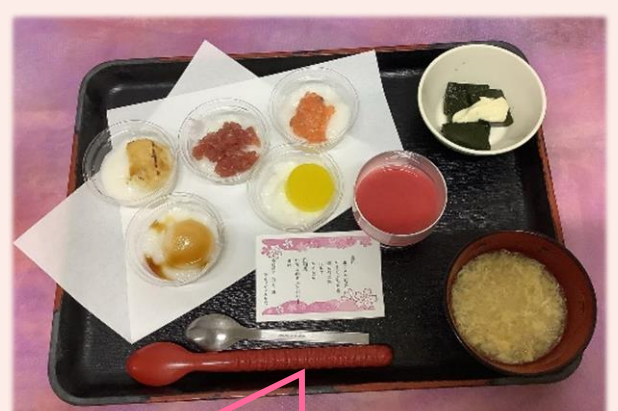
なめらか食 （ミキサー食）