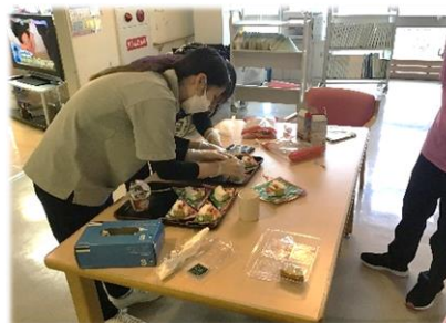
職員がサンタのデコレーションをしたケーキです