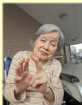
N 様 87歳 4/1生