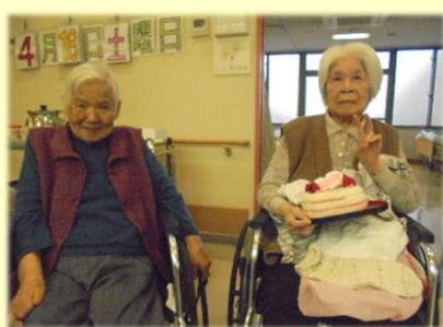
G 様 90歳 4/18生