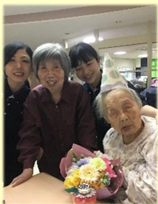
F 様 96歳 4/4生

今は皆で集まることが出来ず、少人数でのお祝いになりますが、ご本人様にとって良い一年になるよう願って行っております。