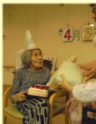
Y 様 93歳 4/29生