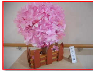
これぞ 桜一本桜 なり～