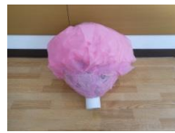
なんと夏場のある ハロウィンのようなシルエット

桜の花が満開です。 作品を作りながら 「きれいね～きれいね～」が たくさん飛び交っていました。